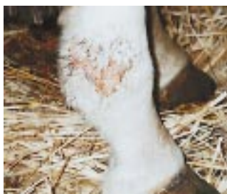
Mauke an Fesselkopf

SkinGuard fluid vermag auch das in der warmen Jahreshälfte auftretende Sommerexzem zu heilen. Hier schätzen die Pferdebesitzer die vollkommen unschädliche, aber verlässliche Wirkung der Salbe.