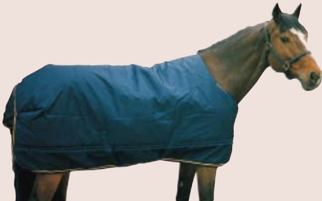
Farbe: dunkelblau mit gelbem Einfass Ab Ende September exklusiv bei Ihrem Euroriding-Fachhändler erhältlich!

Diese mittelschwere, wasserdichte, atmungsaktive und mit 200 oder 400 g Polyesterwatte gefüllte Decke bietet Schutz für Ihr Pferd auf der Weide und im Stall.