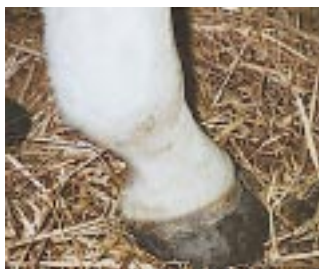
Durch die Behandlung mit Skin Guard wurde die Mauke zum Abklingen gebracht

Pferdebesitzer berichten ebenfalls von positiven Erfahrungen bei nur einmal täglicher Anwendung gegen Wunderscheinungen, Satteldruckstellen sowie Insektenstiche.