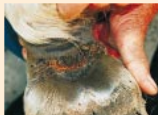
Die Mauke in der Fesselbeuge ist eine Erkrankung, die vorwiegend in den Herbst-/Wintermonaten auftritt.

Ob bedingt durch schlechte Hufqualität, eine gewisse Veranlagung oder ungenügende Hufpflege - die Strahlfäule bei Pferden ist besonders im Winterhalbjahr vakant. Stallhaltung, bei der das Pferd in feuchter, ammoniakversetzter Einstreu steht, und Matsch im Auslauf sind für diese Jahreszeit typische Auslösefaktoren. Bei Strahlfäule handelt es sich um einen Zerstörungsprozess des Hufhorns, der von Fäulnisregnern veranlasst wird. Besonders betroffen sind Hufsohle und Strahl. Es entstehen Spalten und Aushöhlungen, die mit einer übelriechenden Masse gefüllt sind. Die Behandlung erfolgt, indem die zerklüfteten Hornmassen mit